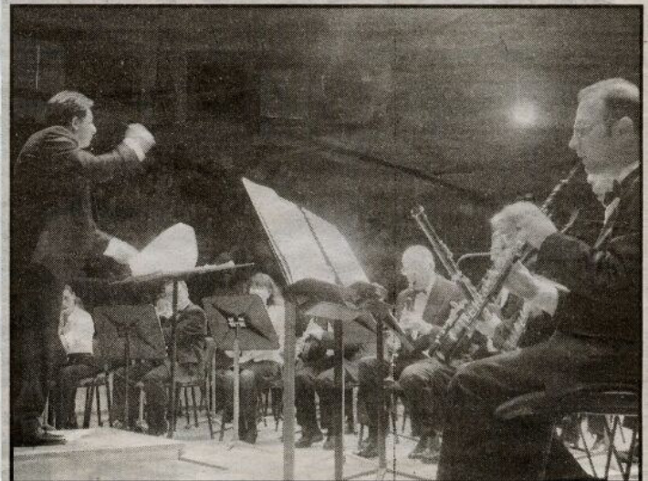
Un événement que Jules Verne aurait sûrement apprécié, hier, au cirque d'Amiens où l'inauguration du 23 juin 1889 de cet édifice emblématique a été reconstituée en présence de 200 musiciens d'Amiens et de Nantes (notre photo). Le discours inaugural du conseiller municipal de l'époque, Jules Verne, a été lu par l'artiste de scène, Michel Duchaussoy.

honnoraire de la Comédie Française et artiste de scène, a fait revivre le discours mémorable de Verne.