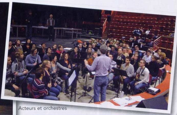
Acteurs et orchestres