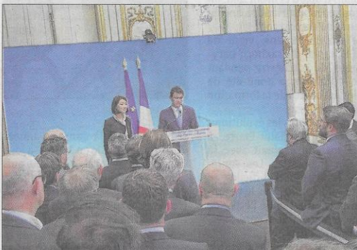
MAI ▲ La Métropole signe le pacte culturel à Matignon et s'engage, comme le ministère, à maintenir ses crédits jusqu'en 2017.