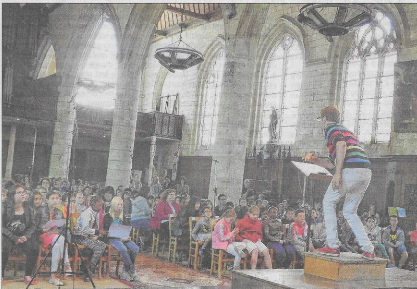
JUIN ▲ Quelques 350 enfants des écoles d'Amiens et de la métropole ont participé à une séance d'enregistrement qui nourrira le projet Rizhome, l'œuvre musicale du compositeur Nicolas Frize, conçue pour campus à la citadelle.

Retour en images sur les événements qui ont marqué l'actualité. Amiens Métropole a voté son pacte culturel et l'État maintient ses crédits jusqu'en 2017.