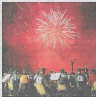
JUILLET ▲ L'harmonie Saint-Pierre accompagne le traditionnel feu d'artifice du 13 juillet tiré au parc Saint-Pierre.