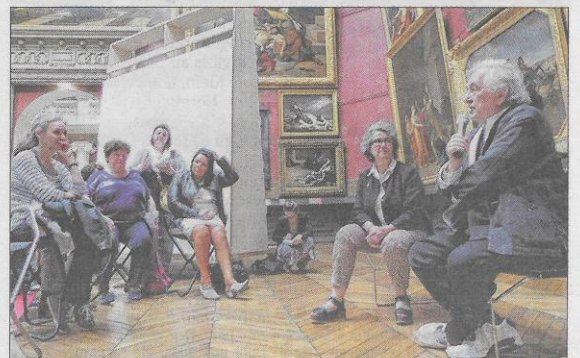
JUIN ▲ Le musée de Picardie a accueilli une installation conçue par l'artiste Daniel Buren tout spécialement pour le Grand salon.